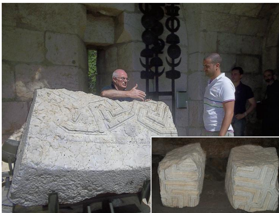
Fig.2 Fragments de décoration sculpturale provenant du second temple ; dans l'encadré à droite, les deux pièces gardées au musée archéologique du SBF

D'une importance particulière ont été l'examen et l'étude d'une proposition d'interprétation concernant deux blocs de pierre sculptés dans le style hérodien qui ont été retrouvés pendant la construction du Sanctuaire de la Condamnation ou du couvent de la Flagellation. Ces deux pièces, ayant déjà appartenu à la décoration intérieure des édifices du second temple sont probablement à rapprocher de la double porte. Le grand intérêt de ces pièces est confirmé par le fait qu'un fragment similaire, mais d'une plus grande dimension, est gardé à la tour de David, dite également Musée de la Citadelle.