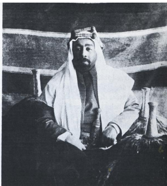
El Emir Abdallah de Jordania