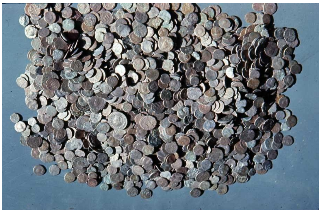
Una foto con los numerosos hallazgos numismáticos

El profesor Ermanno A. Arslan, eminente numismático y director de las Recolecciones Cívicas Arqueológicas y Numismáticas de Milán, ha venido a Jerusalén para colaborar con el Museo arqueológico del SBF. El estudioso se ha dedicado al estudio de la campaña fotográfica y de la recogida de datos metrológicos (peso) de las monedas halladas bajo el empedrado de la sinagoga de Cafarnaún. En particular, el profesor se ha ocupado de los hallazgos inherentes a las trincheras 12, 14 y 18, más otros pequeños hallazgos, por un total de unas 23.000 piezas. Con su valiosa labor ha terminado toda la campaña fotográfica realizada entre los años 1970 y 1972.