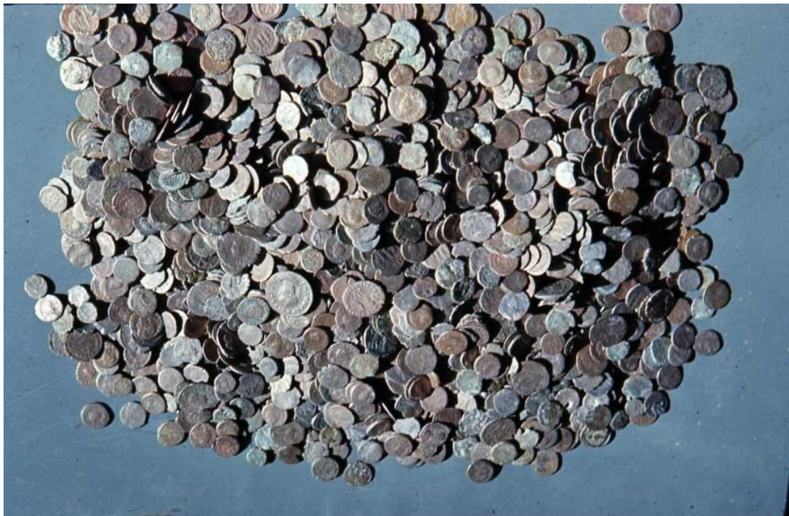
Une photo des nombreuses découvertes numismatiques