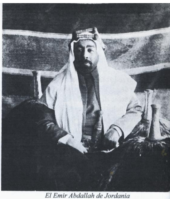
El Emir Abdallah de Jordania