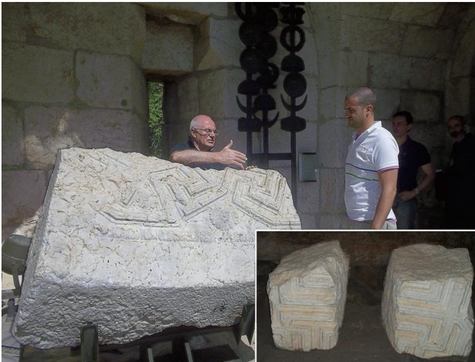
Fig.2 Bruchstücke von Skulpturverzierungen im Jerusalemer Tempel; im unterem Bild sind zwei Stücke die im Archäologischen Museum des SBF ausgestellt werden.

Als von besonderer Bedeutung hat sich die Analyse und Untersuchung zweier Steinblöcke erwiesen. Die Blöcke weisen herodianische Verzierungen auf und wurden während der Bauarbeiten am heiligen Ort der Verdammung und am Kloster der Flagellation entdeckt. Die beiden Blöcke gehörten zu der Inneneinrichtung der Gebäude des Jerusalemer Tempels und waren wahrscheinlich Teile einer Doppeltür. Die bedeutende Rolle der Blöcke lässt sich daran erkennen, dass ein ähnliches, jedoch weitaus größeres Bruchstück, sich im Turm von David Museum befindet.