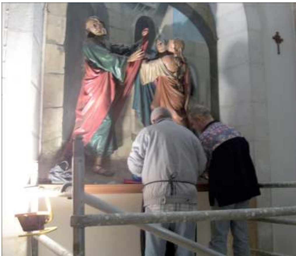
Les restaurateurs à l'œuvre

Avant de partir, ils ont consacré leurs derniers jours de permanence à la réparation d'une pièce d'autel en trois dimensions du sculpteur de Lecce Salvatore Sacquegna réalisée en 1914 et conservée dans le sanctuaire de la Condamnation. L'œuvre montrait les préjudices du temps mais elle était aussi extrêmement endommagée dans les parties accessibles, à cause du grand nombre de visiteurs. Ils ont participé à la restauration en retirant des morceaux inadéquats ajoutés lors de restaurations précédentes, en consolidant, en nettoyant, en plâtrant, en reconstituant sur les plans plastique et chromatique. Il ne s'agissait pour le moment que d'une intervention d'urgence puisque la nécessité d'un traitement plus général sur l'ensemble de l'œuvre a clairement été mise en évidence lors du travail et sera remis à plus tard.