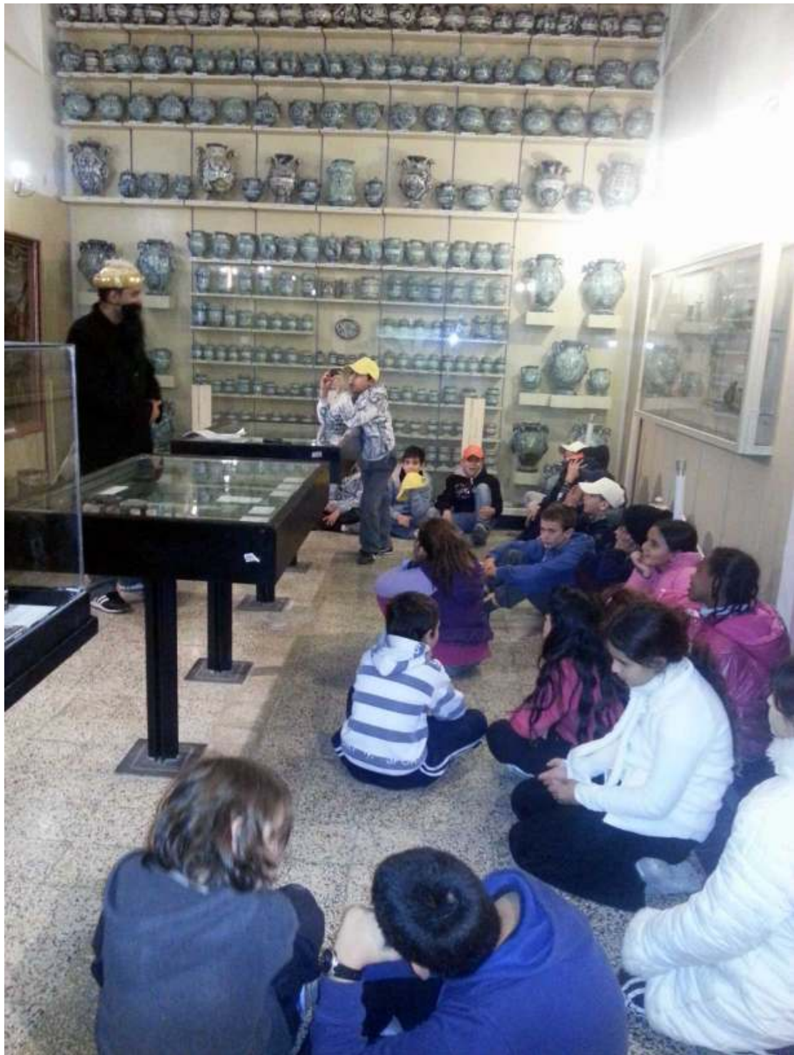
Le groupe d'enfants présents lors de la représentation

direction tout en s'exposant. Le choix du lieu n'est pas anodin : face aux nombreuses notes peintes sur les innombrables vases de cette même Pharmacie, l'influence de la médecine orientale traditionnelle, arabe et juive sur la science médicale occidentale apparaît évidente. Cette démonstration constitue donc un enseignement très valide concernant l'opportunité d'intégration entre des cultures différentes.