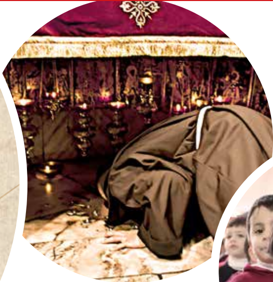
Custodia della Basilica della Natività

I suoi dati personali sono raccolti da Associazione di Terra Santa, titolare del trattamento, per fornire informazioni sulle sue iniziative. I dati possono essere conosciuti esclusivamente da soggetti autorizzati, responsabili ed incaricati del trattamento. In ogni caso i dati non sono comunicati a terzi né diffusi e vengono gestiti con supporti informatici, garantendone la custodia. L'interessato può ottenere l'aggiornamento, l'integrazione o la cancellazione scrivendo al titolare all'indirizzo sostenitori@proterrasancta.org .