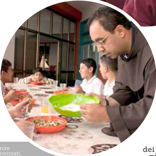
Opere di carità a favore dei bambini più poveri