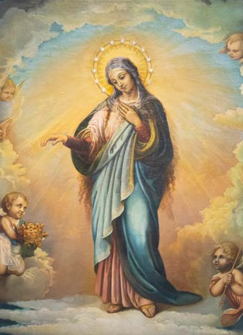
Maria dona la pace in Terra Santa